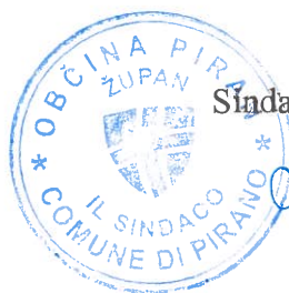
Andrej Korenika Sindaco del Comune di Pirano

di modifiche e integrazioni al Regolamento sulla sovvenzione dell'allacciamento alla rete fognaria pubblica nel territorio del Comune di Pirano , approvato dal Consiglio comunale del Comune di Pirano durante la 29 a seduta ordinaria in data 21 ottobre 2025.